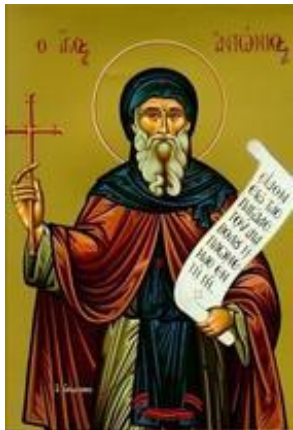
Преп. Антоній Великий 30 січня

Причасний: Хваліте Господа з небес, хваліте його на висотах. Алилуя, трічі.